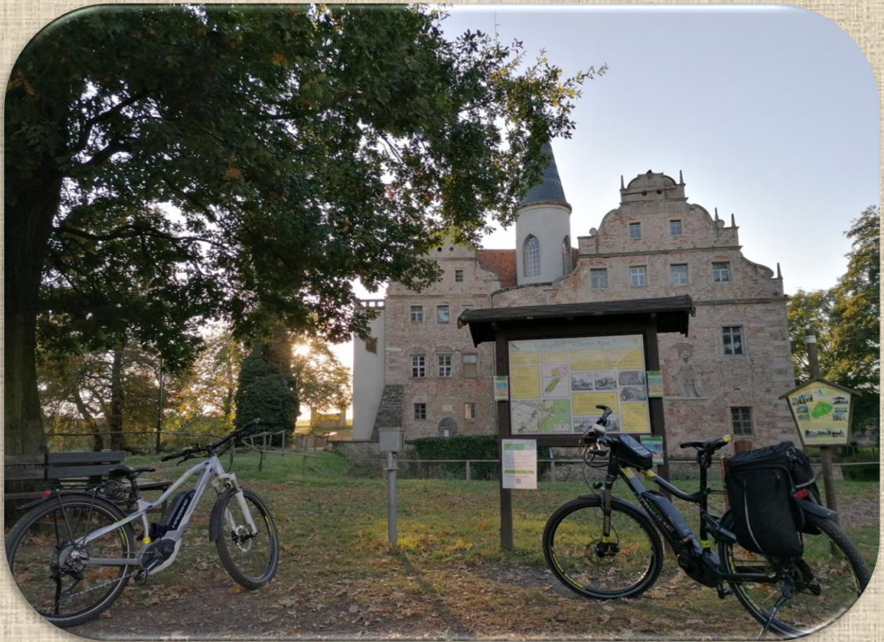
Das Wasserschloss Oberau gilt als das älteste Sachsens. Es entstand aus einer mittelalterlichen Wasserburganlage.