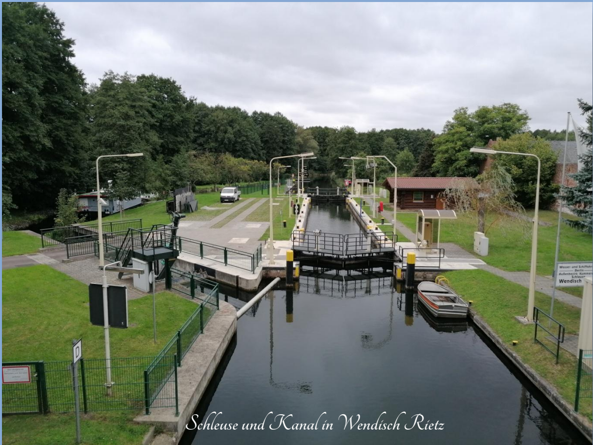
Schleuse und Kanal in Wendisch Rietz