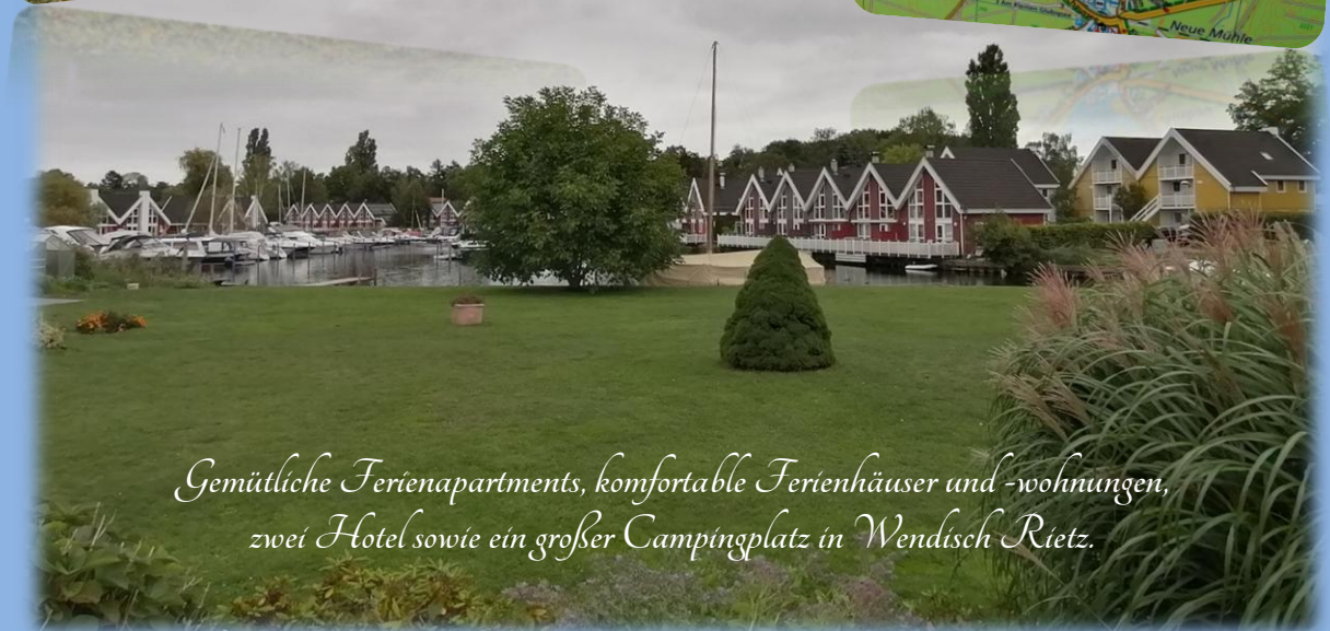
Gemütliche Ferienapartments, komfortable Ferienhäuser und -wohnungen, zwei Hotel sowie ein großer Campingplatz in Wendisch Rietz.