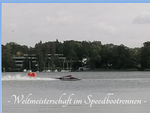
- Weltmeisterschaft im Speedbootrennen -

Baden, Stand-up-Paddeln, Segeln, Tauchen, Angeln, Fahrgastschiff-Rundfahrten und in der Umgebung Radfahren, Wandern, Inline-Skaten, Golfen oder Tennis.