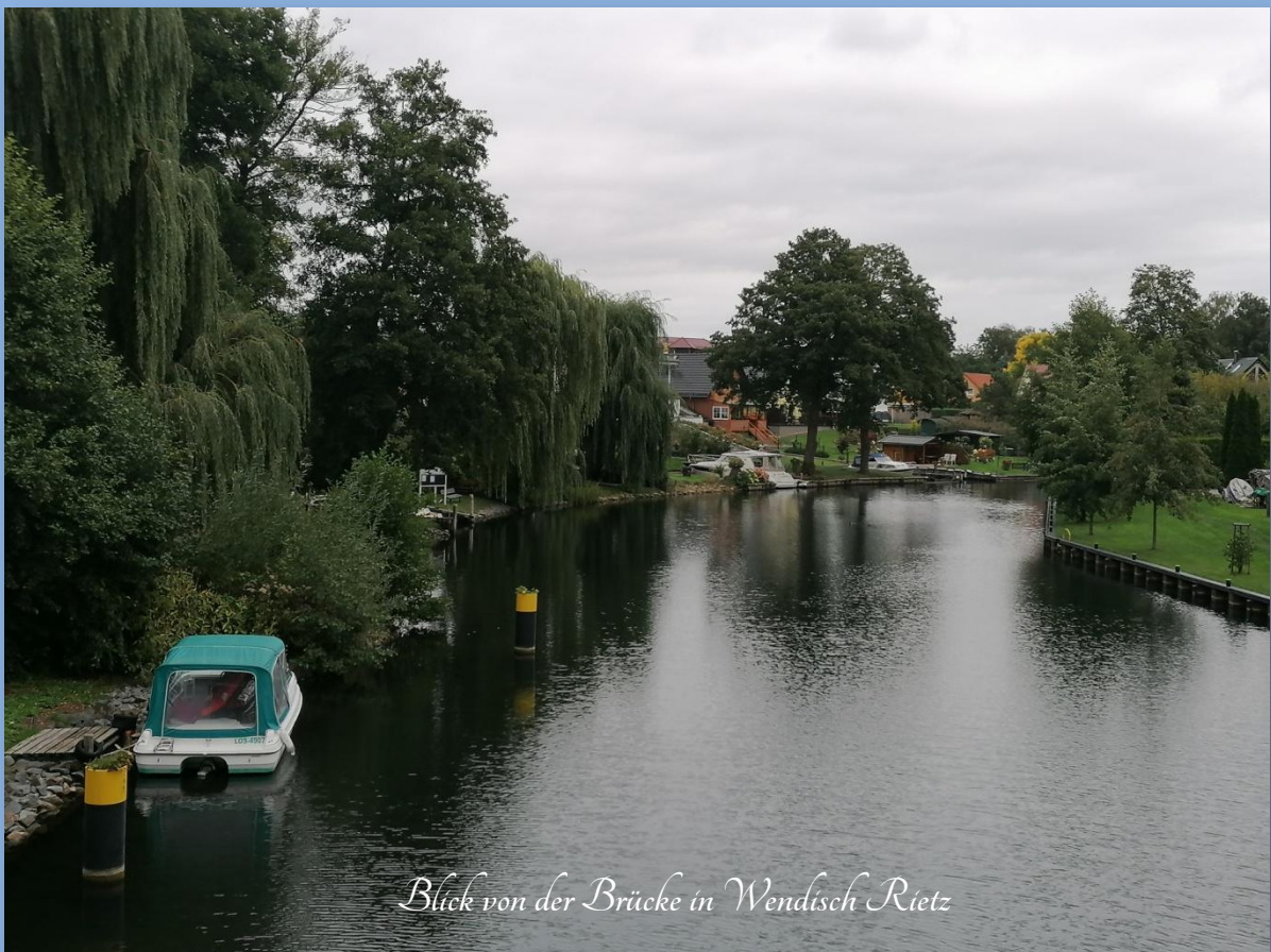
Blick von der Brücke in Wendisch Rietz