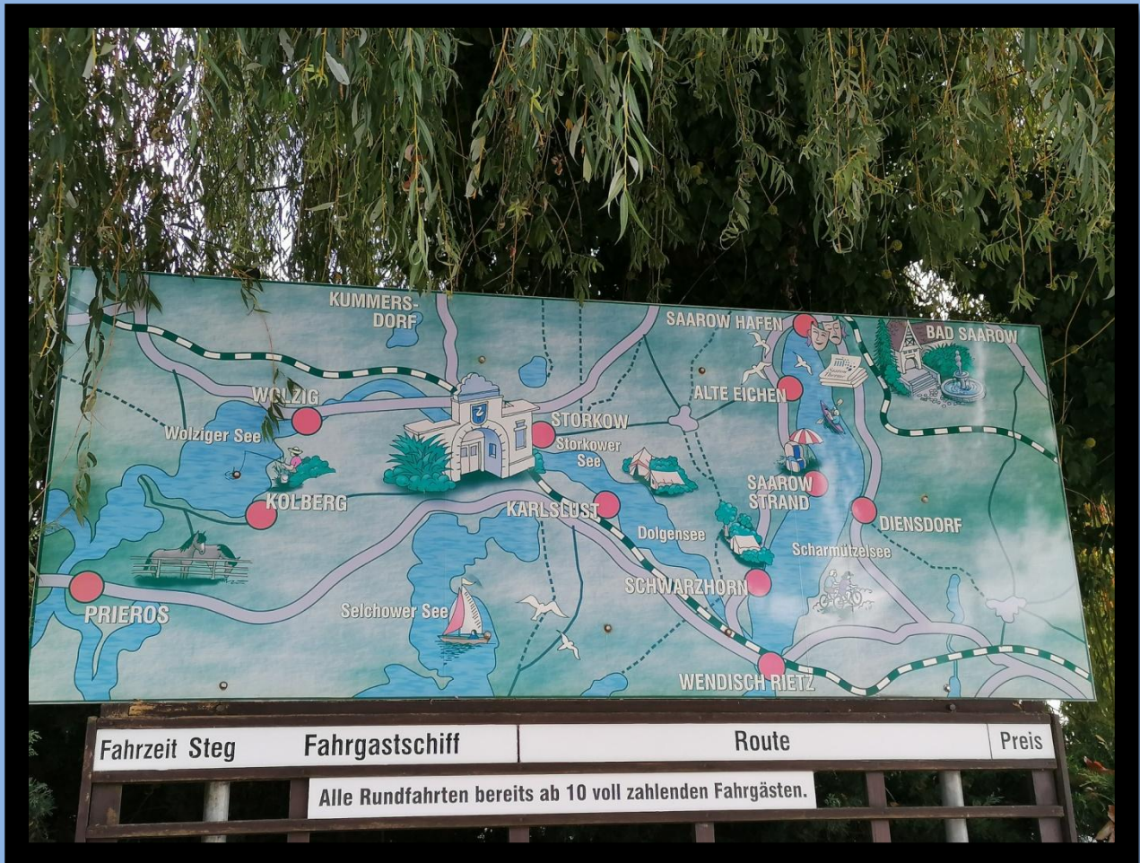
Schiffahrt-Rundfahrt: Aktiv die Region erkunden. Fahrpläne hängen vor Ort aus.