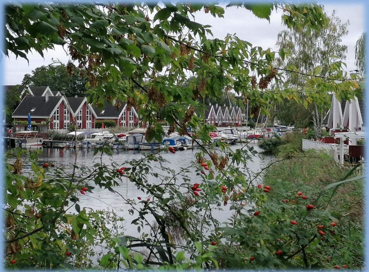
Ferienpark Scharmützelsee - mit Häuschen an Häuschen